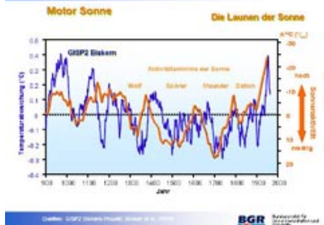
Grafik 2: Klimafakten 900 n. Chr. bis heute: Die Sonnenaktivität beeinflusst die Temperaturkurve (Grafik Geozentrum)