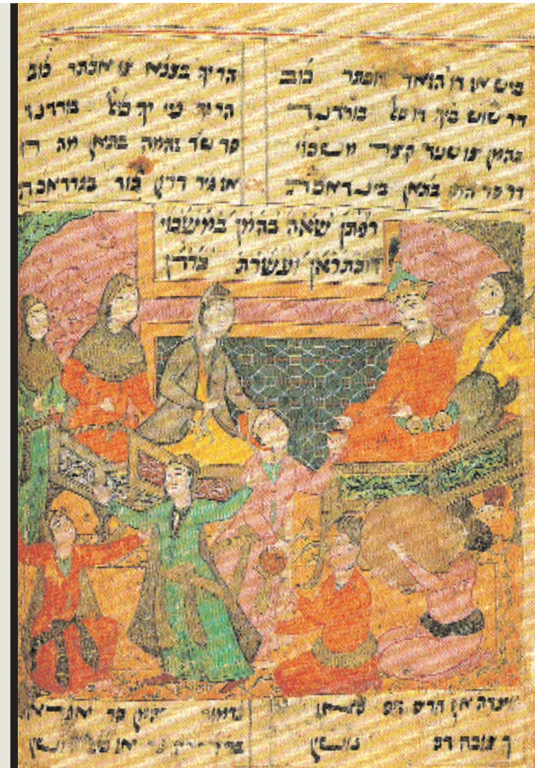
Die Juden gehen auch in den Mittleren Osten. Eine Handschrift aus Persien überliefert um 1650 die Geschichte der Esther, die ihre Glaubensbrüder rettet