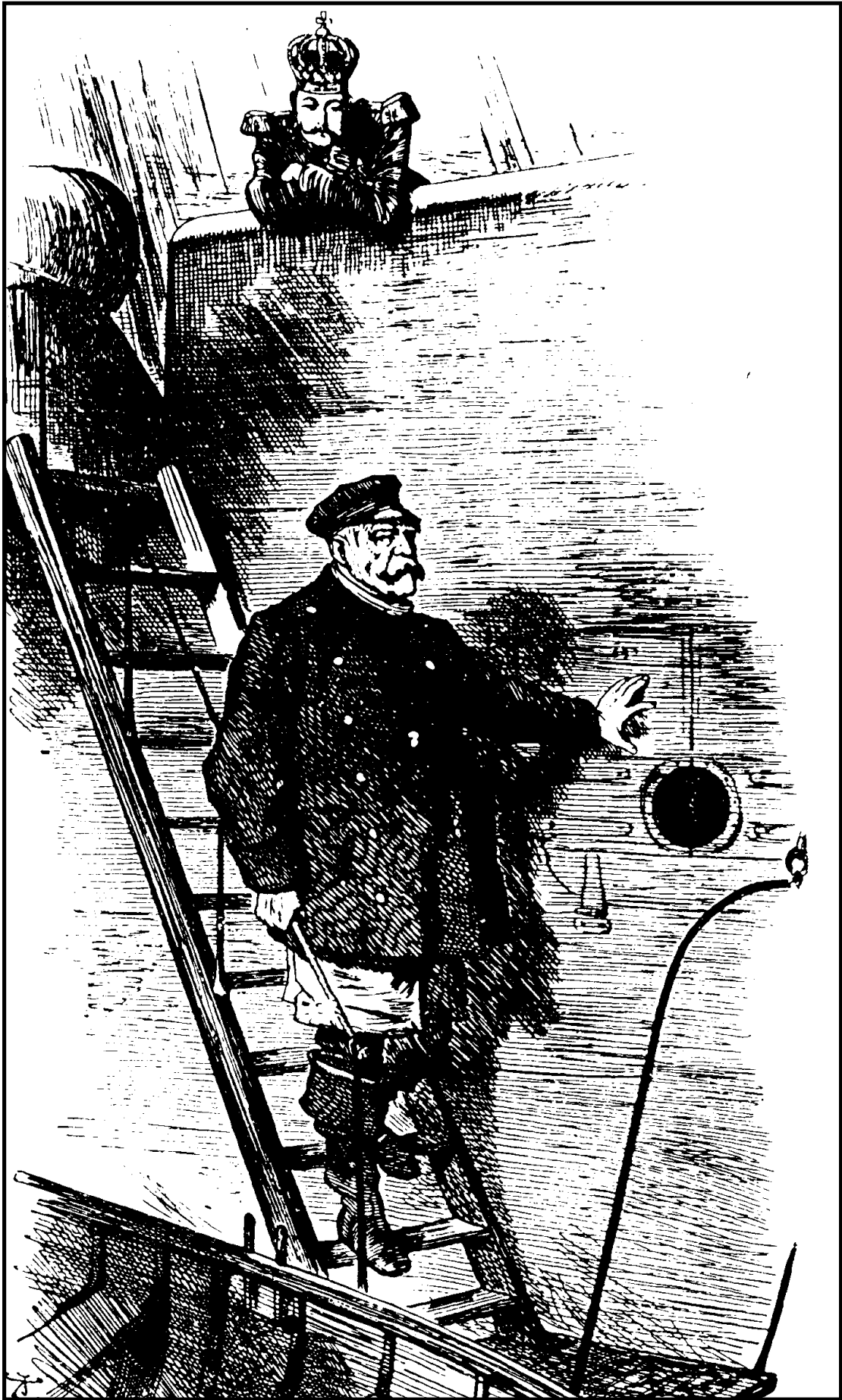
Dropping the pilot Aus „Punch“ (London), 29. März 1890.